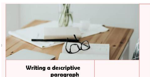
Gambar1: Ppt "Writing a descriptive paragraph"

Untuk menerangkan penggunaan teknik mind mapping dan list of questions (WH-Q) digunakan ppt sebagai salah satu alat atau media untuk menerangkan cara mendapatkan ide dengan menggunakan teknik mind-mapping dan dihari kedua menggunakan cara list of questions (dengan menggunakan WH-Q)