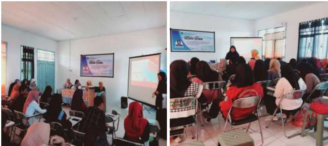
Gambar 1. (a) Pembukaan Kegiatan, (b) Proses Pelaksanaan pemberian Materi

kelompok, di mana setiap kelompok merancang prototype media pembelajaran audio-visual untuk topik fisika tertentu dan mempresentasikannya di depan peserta lain untuk memperoleh umpan balik. Selanjutnya, sesi refleksi bersama dilakukan untuk membahas kendala, peluang, dan rencana implementasi media tersebut dalam kegiatan perkuliahan. Kegiatan ditutup dengan tahap evaluasi melalui pengumpulan angket yang bertujuan menilai peningkatan pemahaman dan keterampilan mahasiswa sebelum dan sesudah kegiatan, serta diskusi tindak lanjut dengan dosen pengampu untuk memastikan hasil kegiatan dapat diintegrasikan ke dalam perkuliahan reguler.