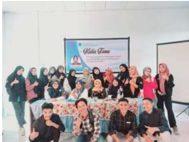
Gambar 2. Sesi Akhir Kegiatan