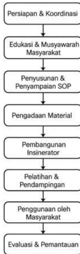
Gambar 1. Alur Kegiatan

Berikut ini adalah tampilan gambar perencanaan pembangunan insinerator: