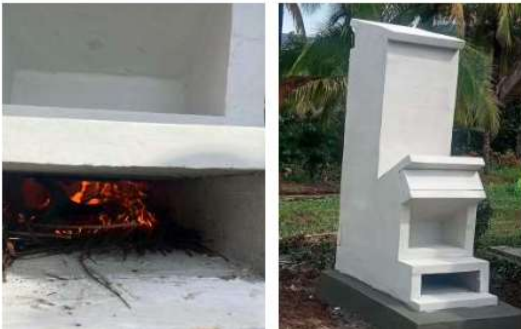
Gambar 4. Hasil Pembangunan Insenerator

Faktor pendorong dalam pelaksanaan kegiatan PKM ini meliputi respon positif dari pihak desa, partisipasi aktif masyarakat dalam setiap tahapan kegiatan, serta dukungan yang diberikan oleh perangkat desa dan kader kesehatan yang turut membantu pelaksanaan program. Di sisi lain, beberapa kendala muncul sebagai faktor penghambat, antara lain ketidaktersediaan pekerja di beberapa desa, kondisi cuaca hujan yang menghambat proses pembangunan, keterbatasan jumlah tenaga kerja sehingga beberapa tahapan harus disesuaikan waktunya, serta miskomunikasi terkait penentuan lokasi pembangunan di salah satu desa yang menyebabkan penundaan hingga klarifikasi dan penetapan ulang dilakukan.