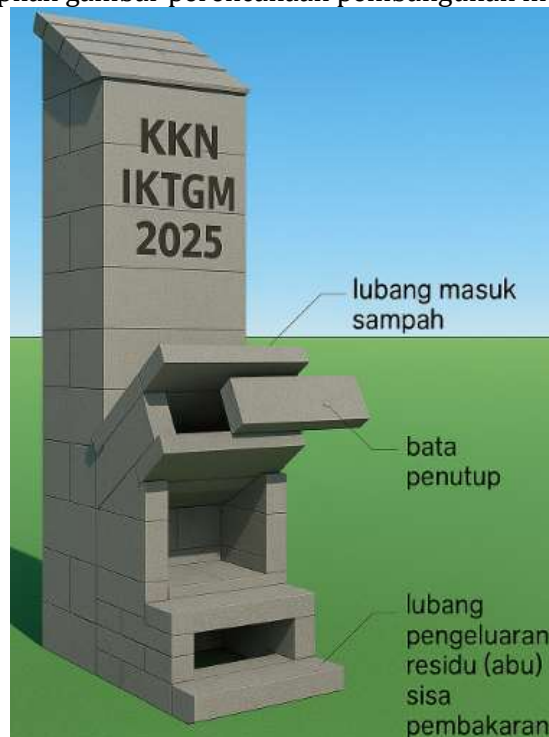
Gambar 2. Rencana gambar insenerator

Berikut ini adalah tampilan gambar perencanaan pembangunan insinerator: